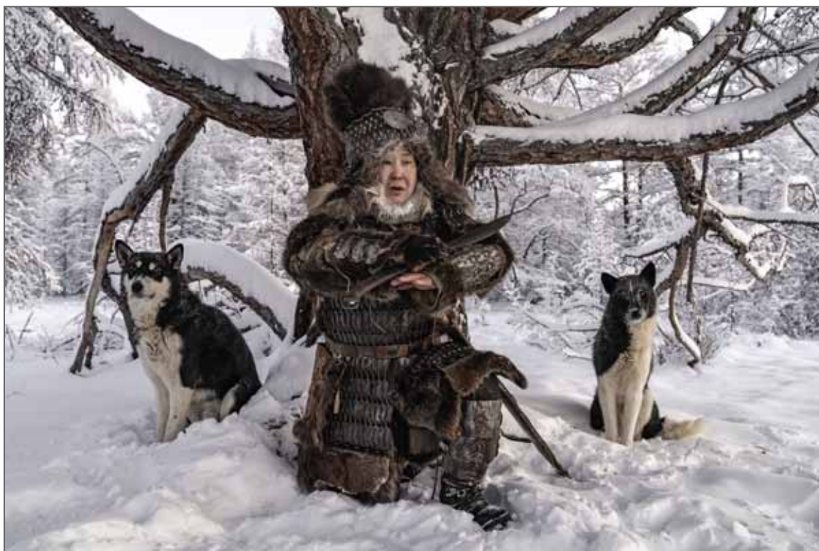
Lauréate de la Bourse Canon de la Femme Photojournaliste 2022

Le nord de la Russie recèle d'innombrables richesses comme l'or ou les diamants, mais aussi les cultures indigènes. Celle des Evenks, en Yakoutie, survit tant bien que mal face aux industriels qui exploitent leurs terres. Peuple autochtone d'éleveurs de rennes, ce sont eux qui ont guidé les prospecteurs russes vers les gisements, permettant le développement industriel de l'Union soviétique. Mais aujourd'hui, la taïga est massivement abattue, les lits des rivières sont saccagés et les nappes phréatiques polluées.