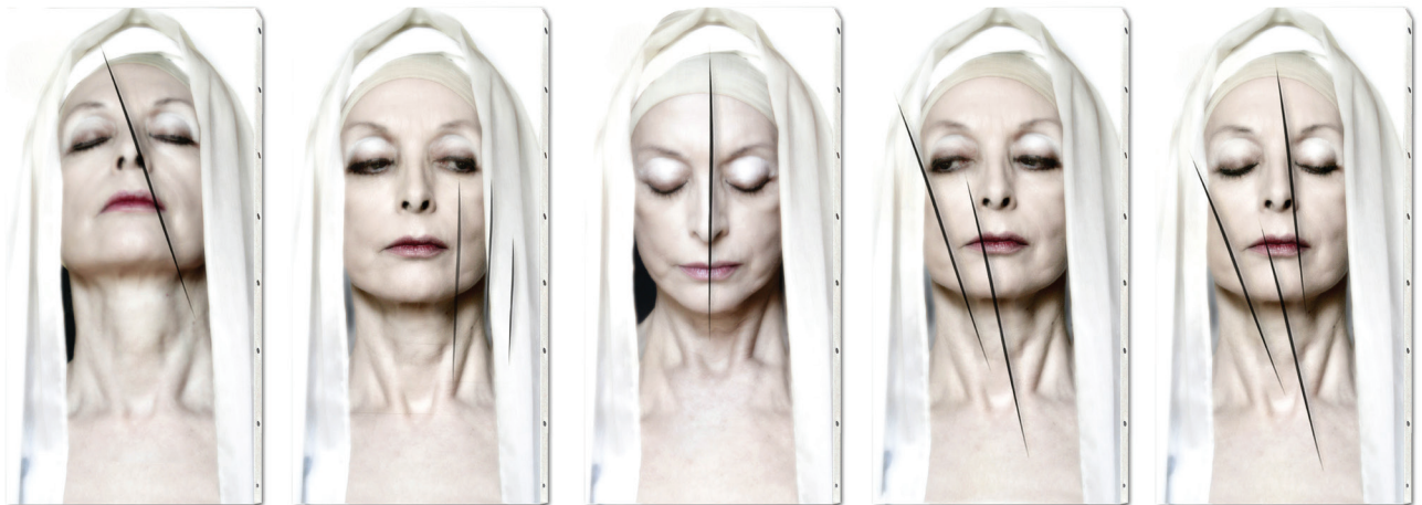
Larmes de Coco (Chanel) . Tirage au jet d'encre sur papier aquarelle Fine Art Museum, 90 x 165 cm, 2020.