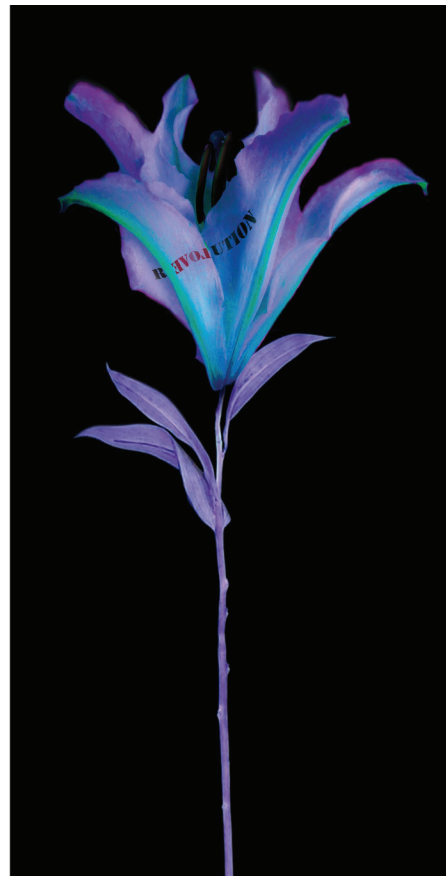
Fleurs blessées (Tulipe, rose et iris). Tirage au jet d'encre sous plexiglas et dibond, 150 x 75 cm, 2017.