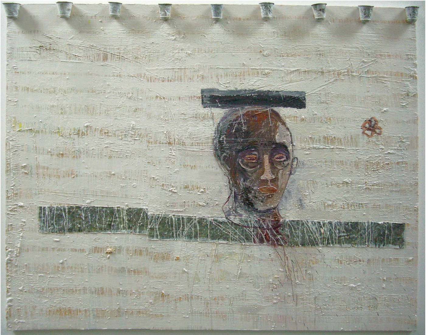
Poète , huile, acrylique, plomb et objets sur toile, 250 x 200 cm, 2007.

« Guy Ferrer s'intitule peintre, sculpteur, voyageur. Voyager est pour lui une nécessité, pire même, une fatalité. Il est à la poursuite de l'imaginaire issu de la terre. Sa peinture n'est pas d'essence continentale mais planétaire. »