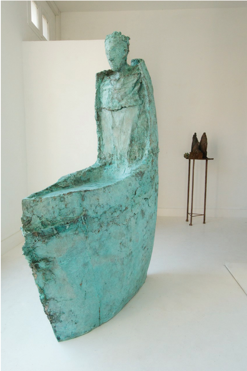
Baptist , bronze, 195 x 53 x 146 cm, 2015.