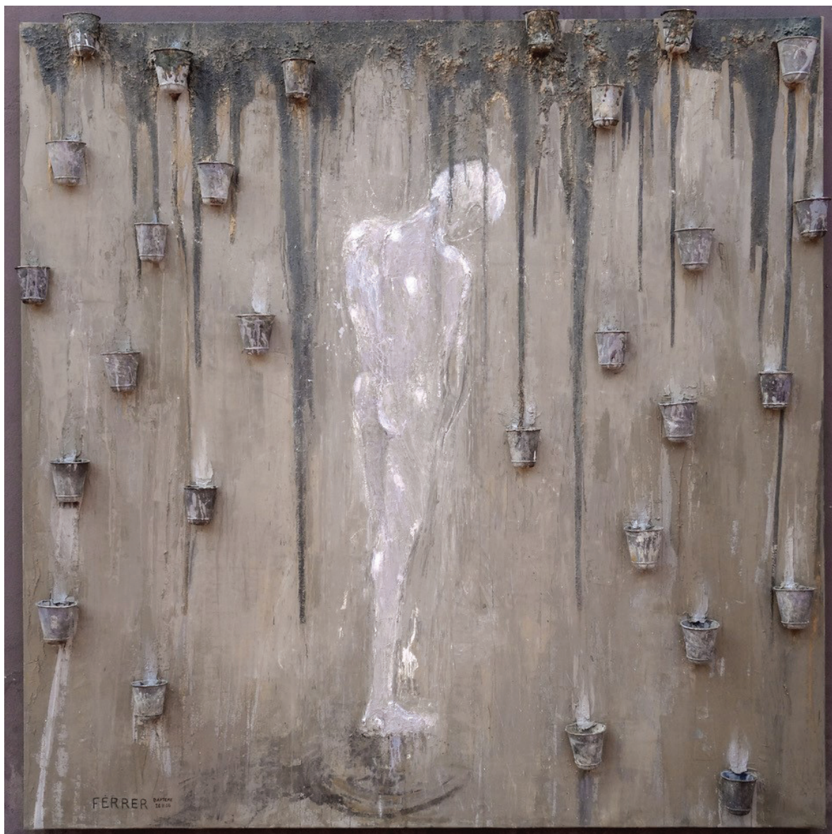
Baptême. Huile et objets sur toile, 200 x 200 cm, 2000.

« L'artiste joue le rôle de conducteur, entre cosmique et tellurique, entre le haut et le bas. Guy Ferrer est un Passeur de messages. »