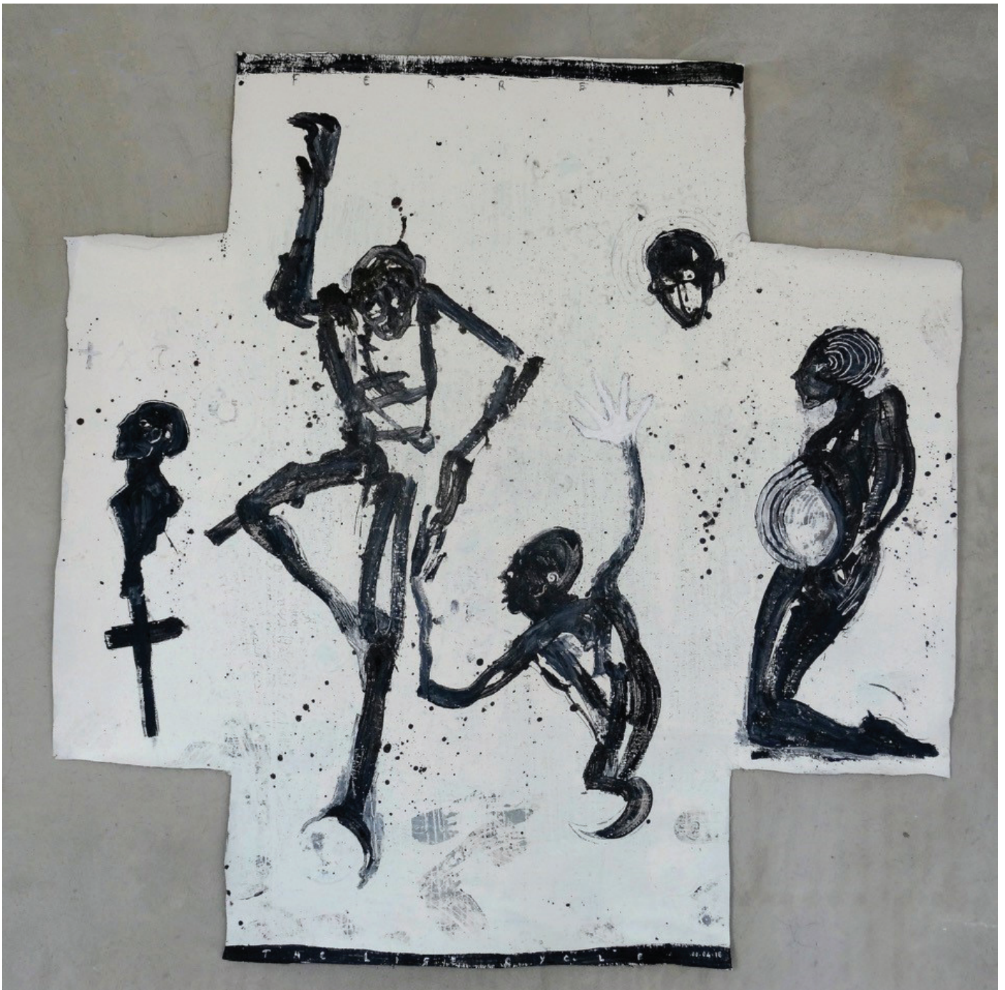
The Life Cycle , huile sur toile, 200 x 200 cm, 2016.