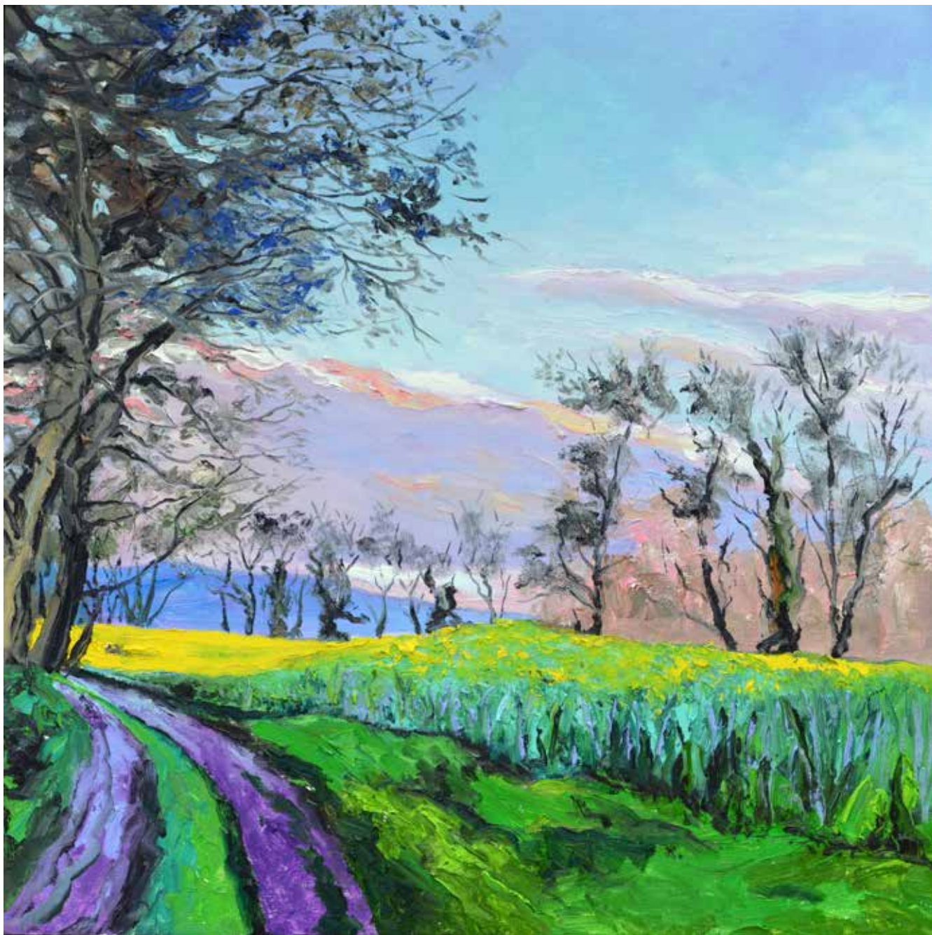
Champs de colza à Divonne-les-Bains. Huile sur toile de lin, 90 x 90 cm.