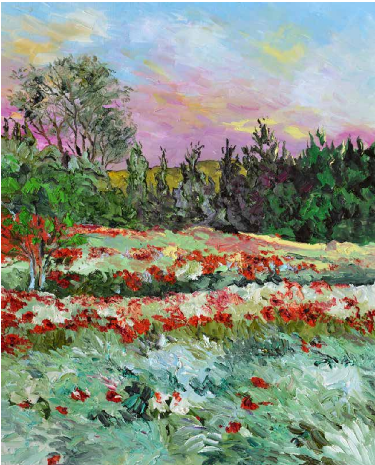
Matin à Mourières. Huile sur toile de lin, 81 x 100 cm.