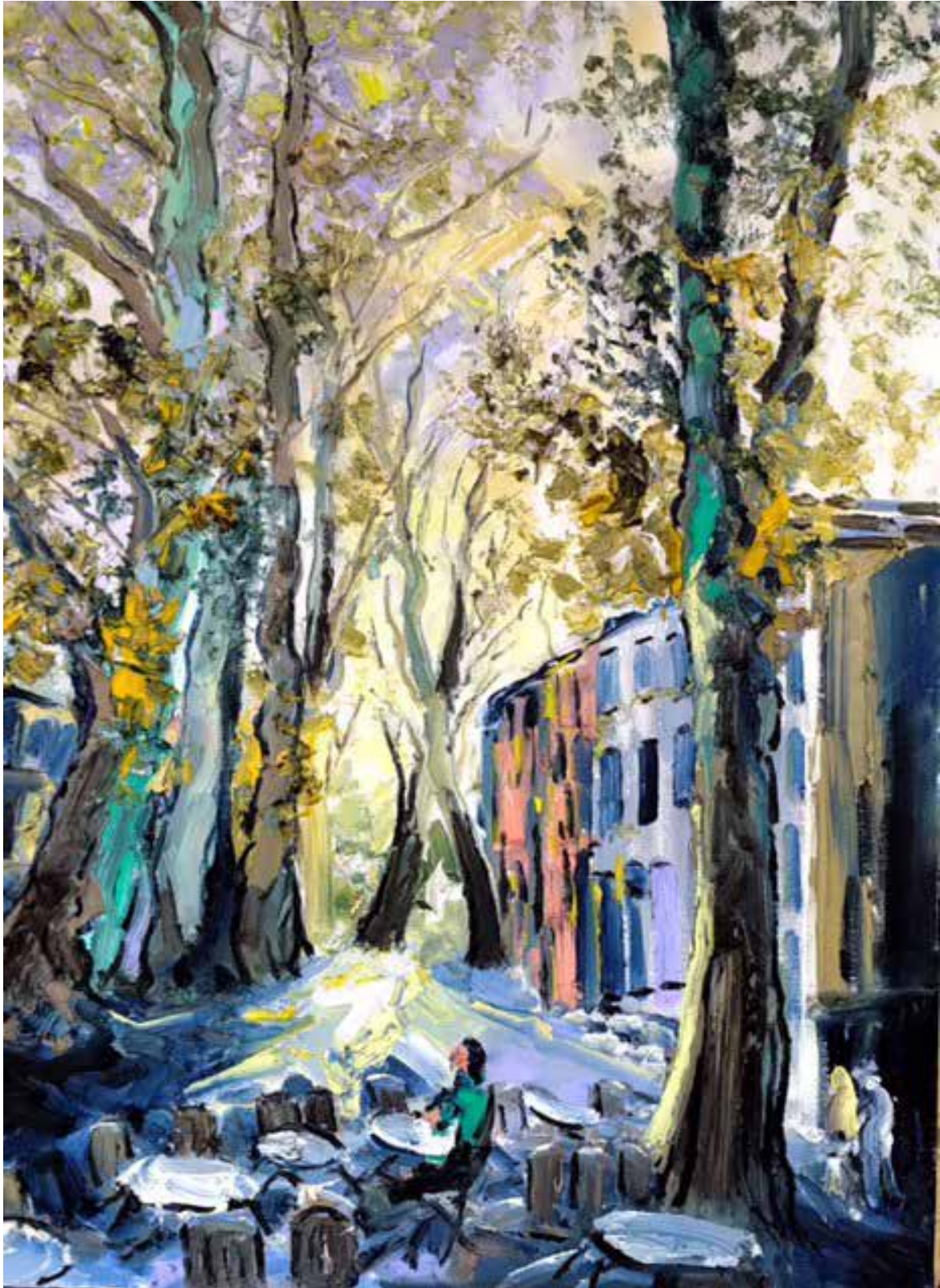
Céret. Huile sur toile de lin, 73 x 92 cm.