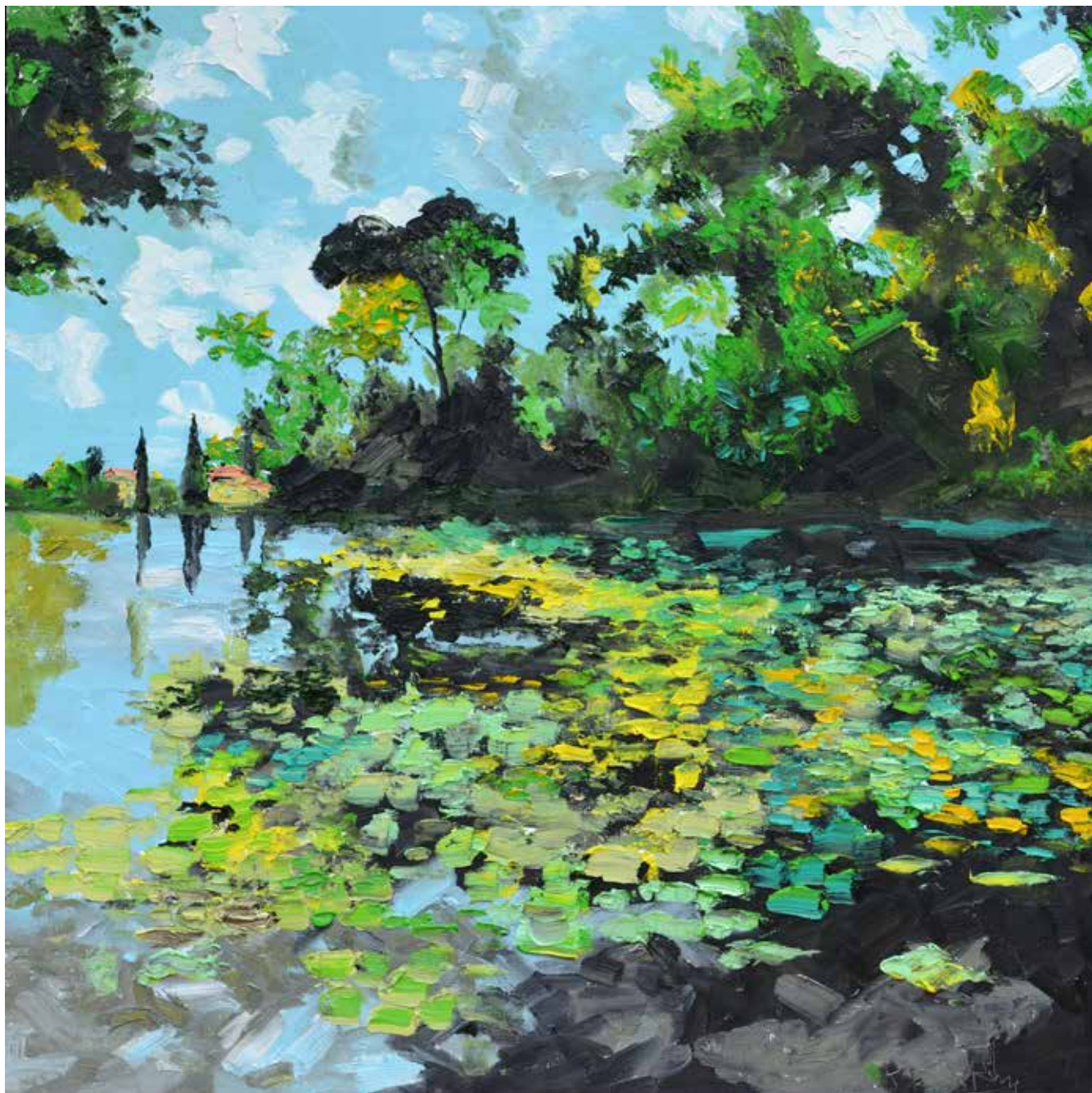
L'étang de Solliès. Huile sur toile de lin, 90 x 90 cm.