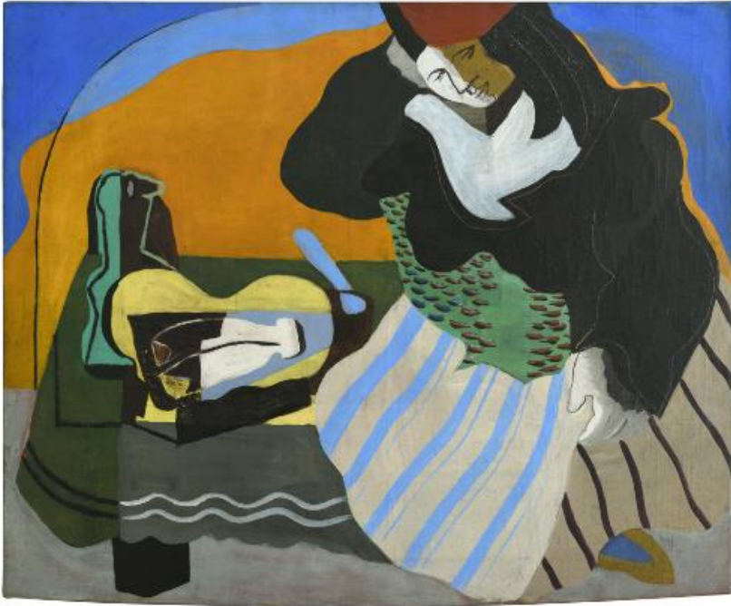
1. Jean Lurçat - Femme turque, 1925, huile sur toile, 83x100 cm. Paris, Fondation Lurçat, dépôt au musée d'art Hyacinthe Rigaud