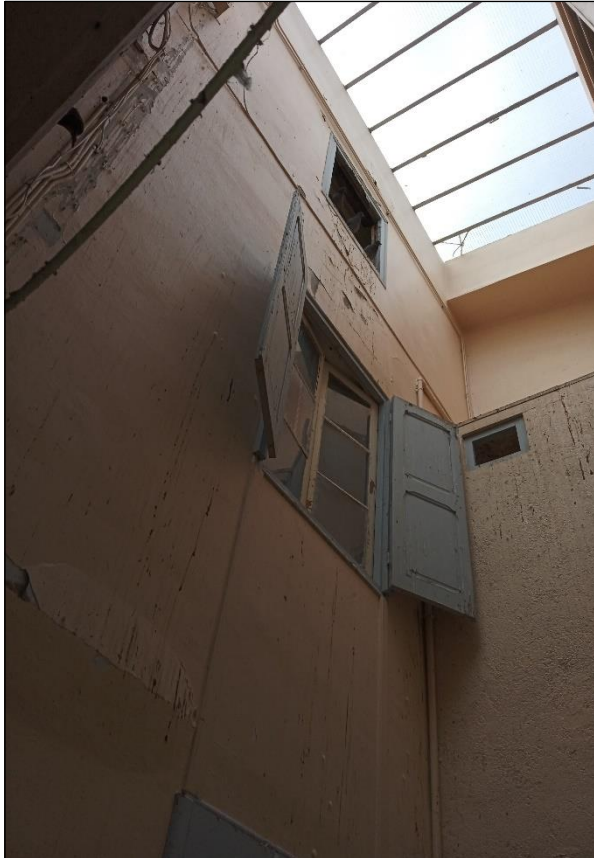
Verrière de la cage d'escalier