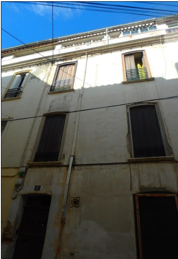
Façade rue de l'Avenir